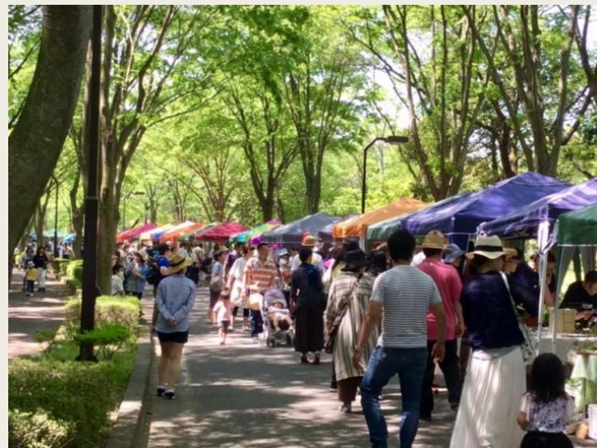
画像は2018ふくしま手づくりマルシェより